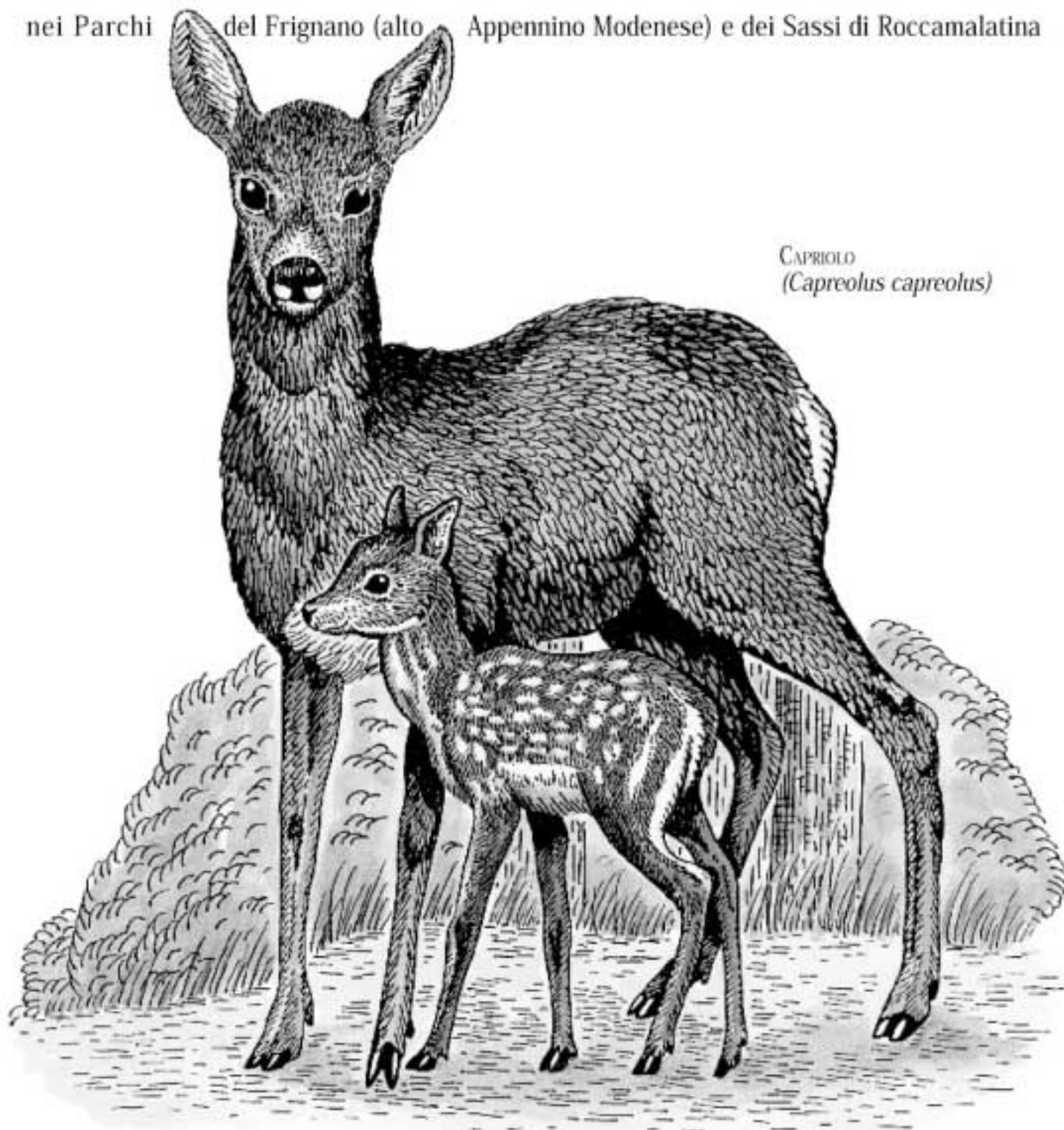
CAPRIOLO ( Capreolus capreolus )

nei Parchi del Frignano (alto Appennino Modenese) e dei Sassi di Roccamalatina