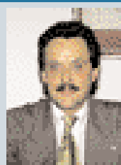
Gian Paolo Verna Alleanza Nazionale

sta formula di centro-sinistra, magari rafforzata. Infine, ritengo sia giusto intervenire per ridare smalto alle competizioni elettorali e quindi alle istituzioni: sono già state fatte proposte per accorpare il voto di Comunali, Provin-