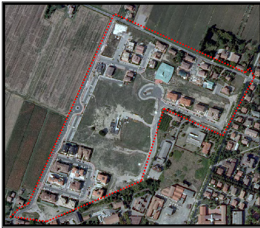
Figura 1 – Ortofoto 2008 dell’area oggetto di Variante al P.P.

Si ritiene che la Variante ai P.P. “Biopep” e “S. Francesco” in Variante al PRG, adottata con Delibera di Consiglio Comunale 57 del 14/04/2011, non abbia necessità di successivi approfondimenti ai sensi del D.Lgs.152/2006 Titolo II, e pertanto possa essere esclusa dalla successiva fase di Valutazione Ambientale Strategica.