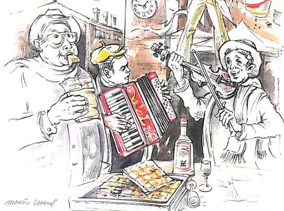
Illustrazione di Mario Cavani gentilmente concessa dal Circolo Filatelico Numismatico Finalese