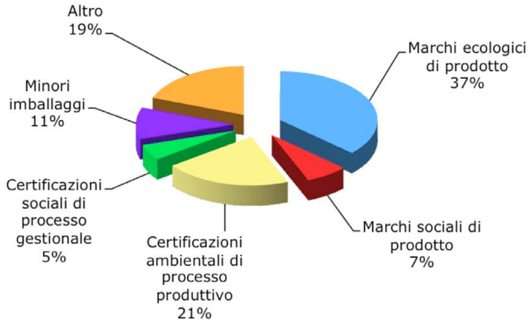
Green Public Procurement in provincia di Modena 2008 Marchi utilizzati